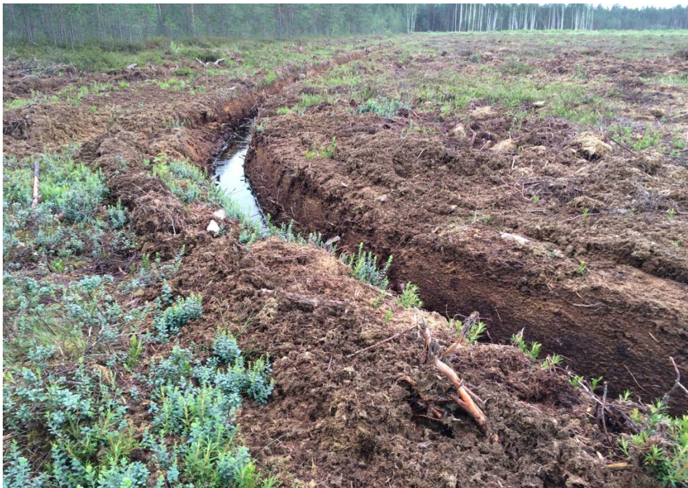
3 attēls, paplašināmo kūdras lauku ainava, kurā redzami linārie elementi, neliels zaļā apauguma īpatsvars, skatu iekļaujošā meža daļa.

Paplašināmie kūdras lauku iekšējo struktūru veido atcelmotu purva virsmu ar atsevišķām celmu kaudzēm un purvam raksturīgo zaļo apaugumu. Arī paplašināmā teritorija ir atdalīta ar kontūrgrāvjiem un sāk iezīmēties brūnie tonji. Vietām vēl pastāv neliels apaugums ar mazām (0,5-1m) priedītēm un bērziem un krūmiem. Paplašināmo teritorijas perimetru iekļauj meža josla, un tālāk par to skats nesniedzas. (att 3)