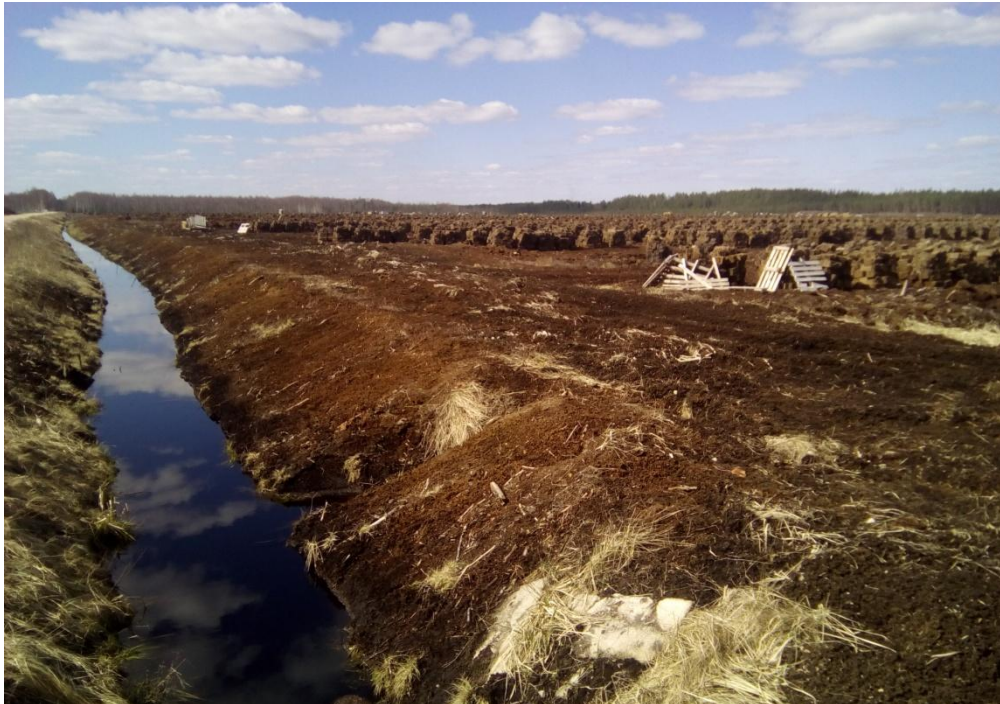
2 attēls, esošo kūdras lauku atklātā ainava, kurā dominē lineārie ainavu elementi

Paplašināmie kūdras lauku iekšējo struktūru veido atcelmotu purva virsmu ar atsevišķām celmu kaudzēm un purvam raksturīgo zaļo apaugumu. Arī paplašināmā teritorija ir atdalīta ar kontūrgrāvjiem un sāk iezīmēties brūnie tonji. Vietām vēl pastāv neliels apaugums ar mazām (0,5-1m) priedītēm un bērziem un krūmiem. Paplašināmo teritorijas perimetru iekļauj meža josla, un tālāk par to skats nesniedzas. (att 3)